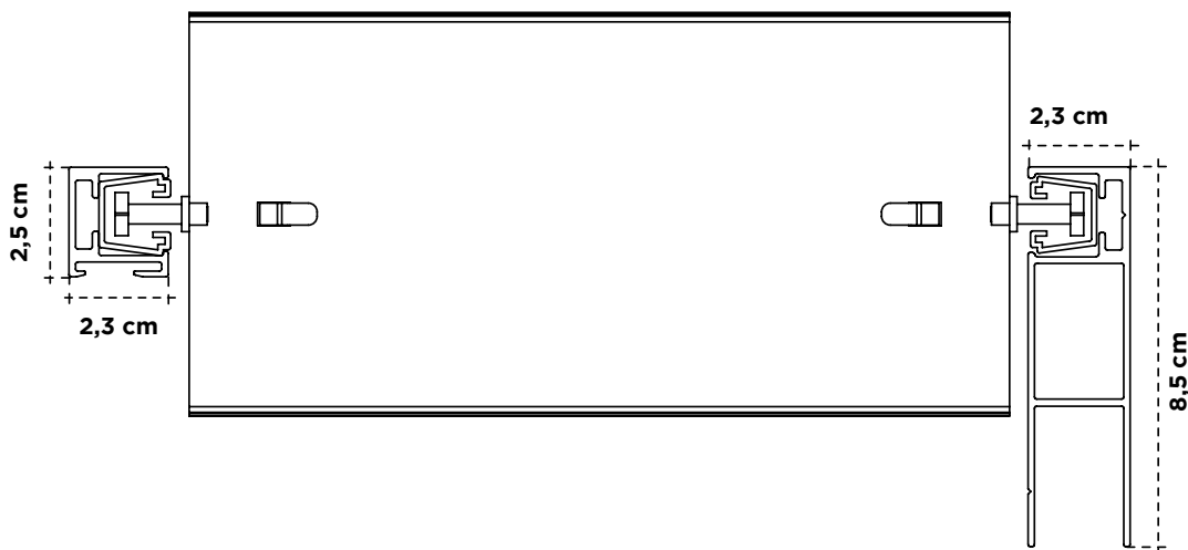
Tabla de repliegue